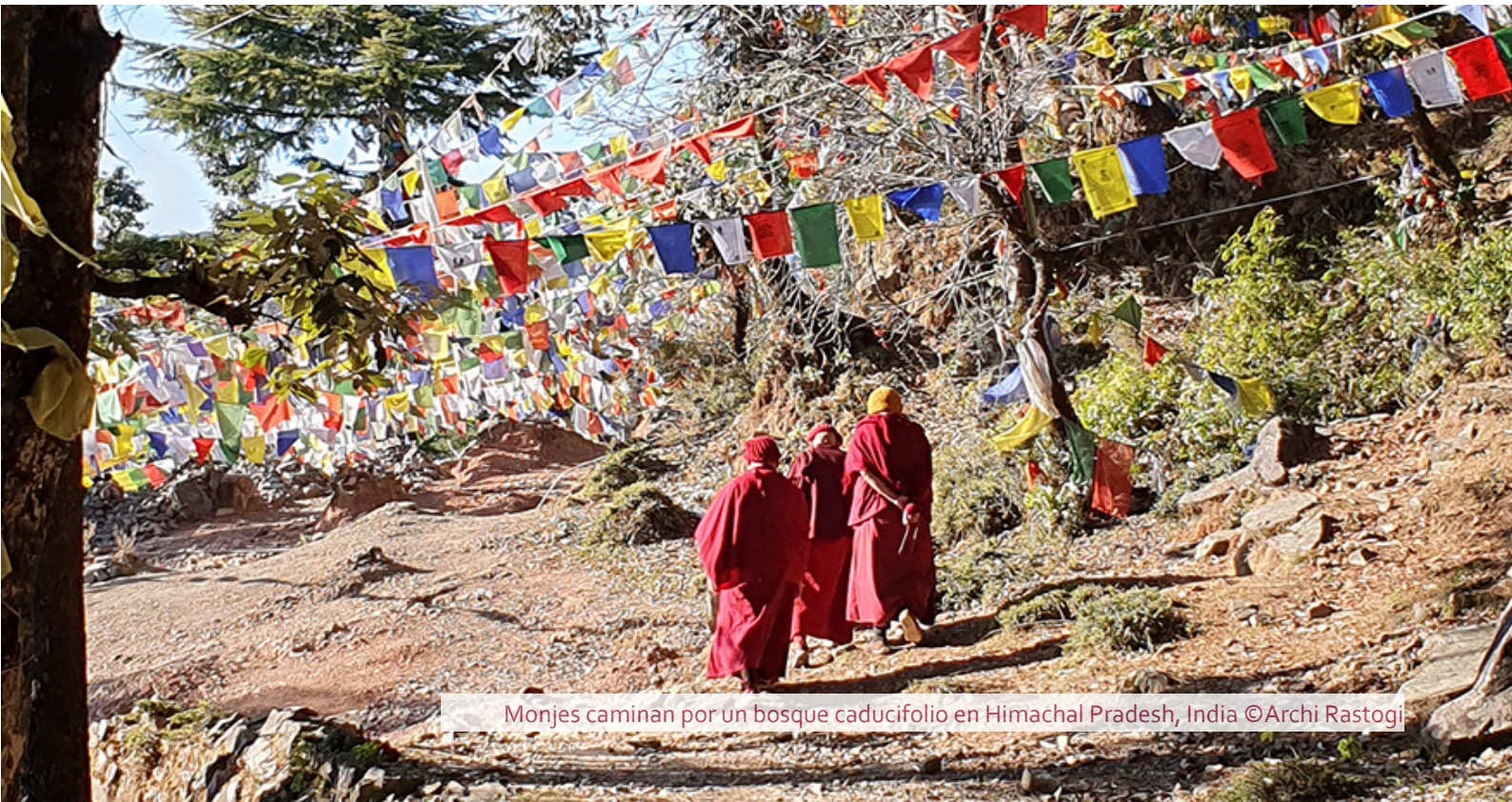
Monjes caminan por un bosque caducifolio en Himachal Pradesh, India

4a. El método de evaluación de proyectos puede complementar la acreditación institucional, pero su estrategia no está clara . Actualmente, el método de evaluación de proyectos no resuelve las trabas existentes: comunicación solo en inglés, largas negociaciones jurídicas, falta de claridad en las comunicaciones, lentitud en las respuestas y las limitadas capacidades de las entidades acreditadas y del GCF para preparar y examinar los proyectos, o el hecho de que la cartera de acreditación y de las propuestas de financiación del GCF se basen en la oferta.